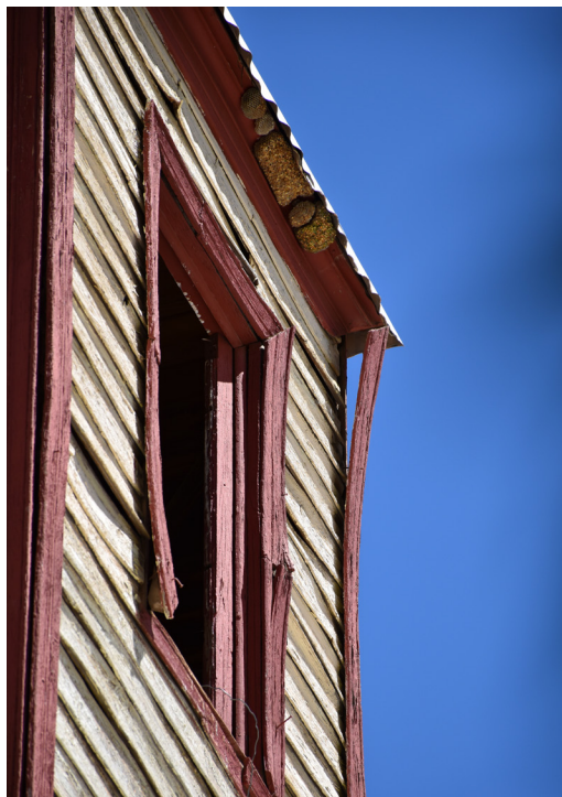
Detalle exterior torre.