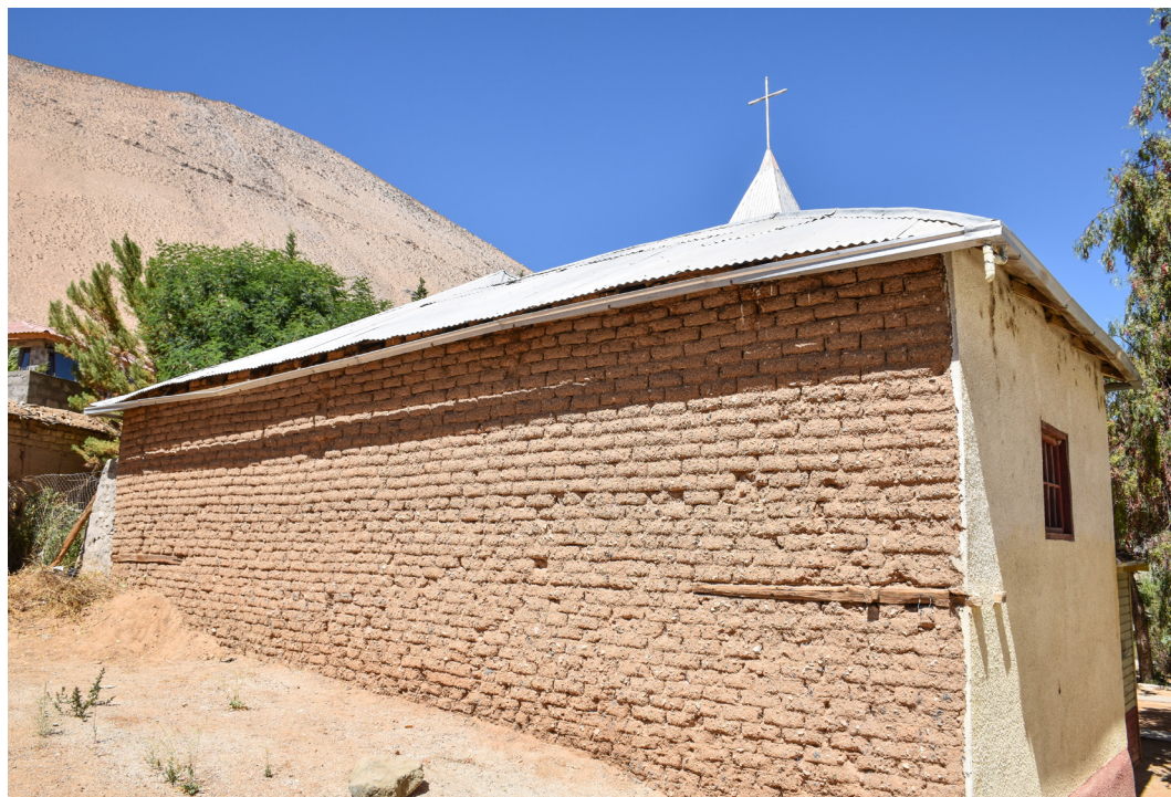
Fotografía elevación posterior.

Por último, la falta de mortero en tabique testero, deja expuesta a la pérdida de material, los adobes por efectos de la abrasión, el viento y las lluvias. En el mismo tabique, es posible observar que los elementos de madera poseen acción de insectos xilófagos inactivos.