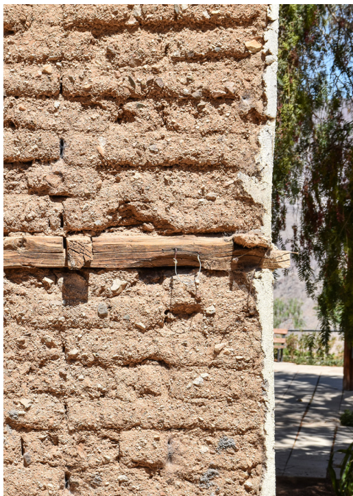
Detalle de estructura expuesta tabique testero.