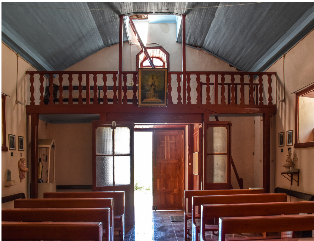
Vista hacia el acceso.