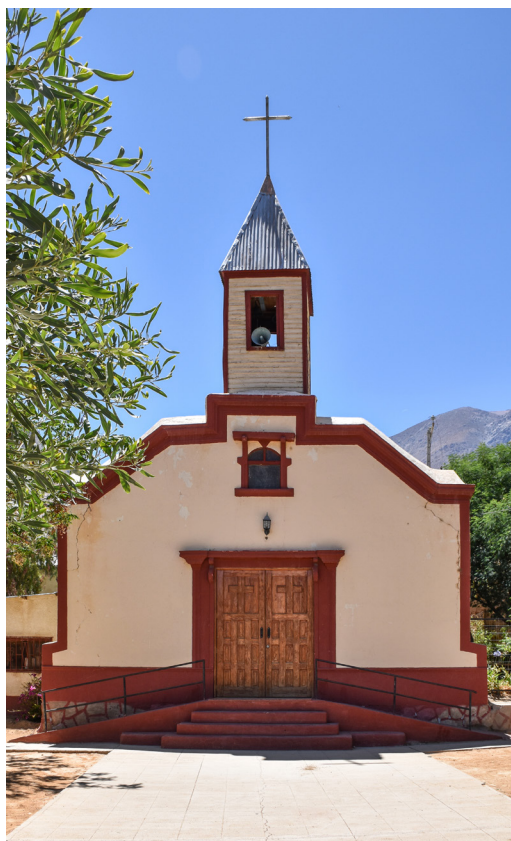
Fotografía de fachada Iglesia Quebrada de Paihuano.

Además, la comunidad cuenta con una imagen de San José y una imagen de la Virgen del Carmen. Se desconoce la data de estas imágenes.