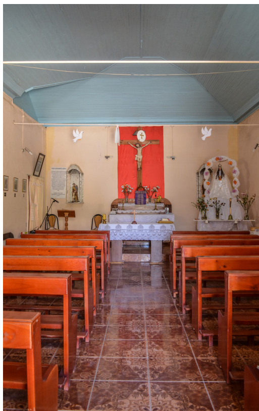
Vista hacia el altar.

Interiormente la nave revestida en piso cerámico, es coronada por una bóveda que no alcanza a configurar un cañón corrido, con cielo de entablado de madera. A diferencia de la mayoría de las iglesias catastradas, no posee retablo, y remata la nave, la imagen de un gran Cristo crucificado. Al final de la nave se encuentra el presbiterio, desde el cual se accede a la sacristía, recinto con estructura y revestimiento de cubierta a la vista. Desde el coro, sobre el acceso de la iglesia, se accede a la torre construida en madera, con el sistema de uniones simple clavadas, sin uso de ensamblés.