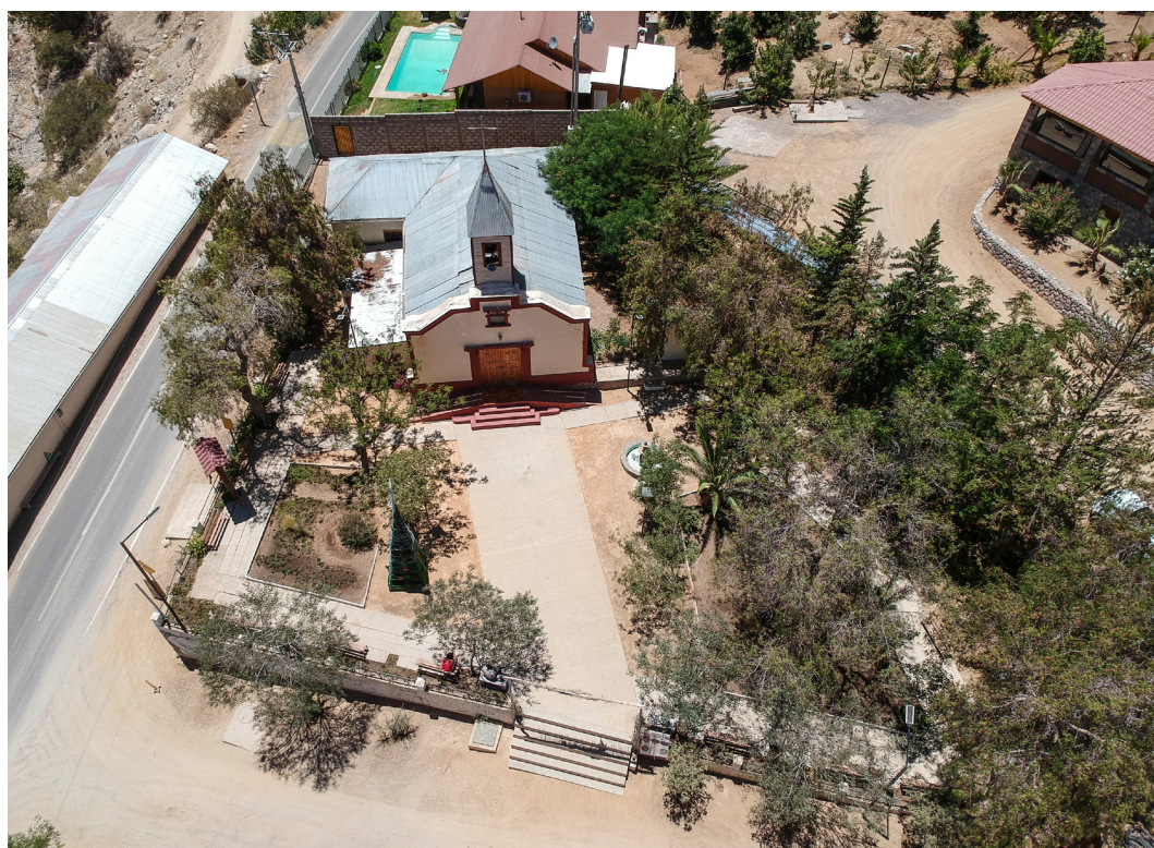
Fotografía aérea contexto Iglesia Quebrada de Paihuano, Comuna de Paihuano.

Visualmente la capilla se encuentra contenida por los cerros que la rodean, y su torre se convierte en un hito dentro del poblado. Se enfrenta a la torre fachada una plaza compuesta de añosos árboles que dan sombra a los vecinos que se acercan a capear el calor; y contiguo a la iglesia, en el mismo predio, existe un patio de oración en honor a la Virgen de Lourdes.