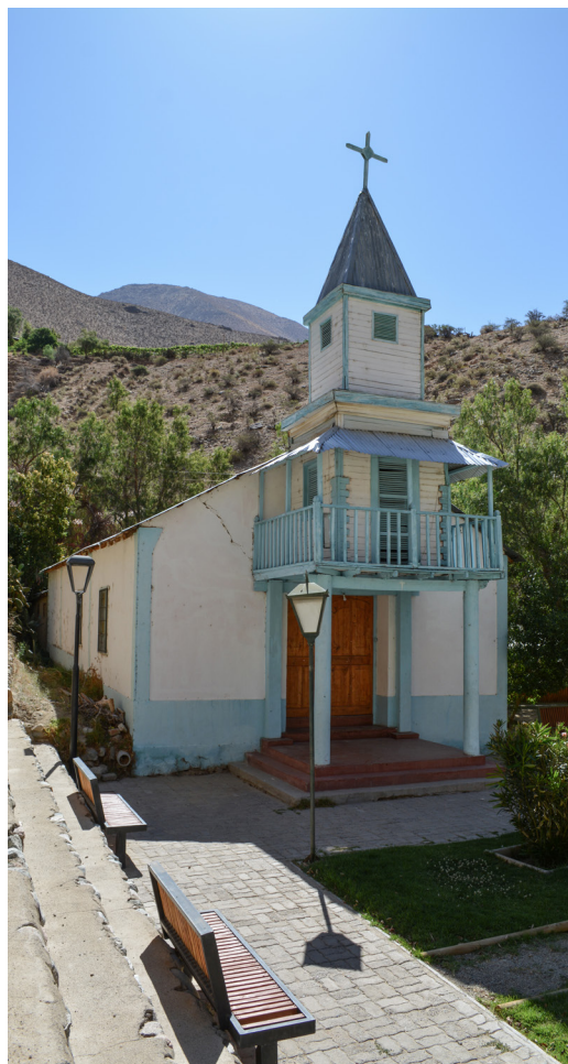
Fotografía exterior Iglesia de Horcón.

FIESTA PATRONAL La fiesta patronal en Horcón, en honor a la Virgen del Carmen, se celebra el domingo más cercano al 16 de julio. La fiesta comienza con la novena, en que la comunidad se reúne a rezar el rosario y luego a celebrar la misa. El día de la fiesta, sale la virgen del Carmen en procesión por el pueblo, junto a Santa Teresita. Según relata la comunidad, en la fiesta religiosa, la iglesia se llena y no cabe en la iglesia. La gente llega por devoción, muchas familias que se fueron del pueblo vuelven para el día de la fiesta patronal, a visitar a sus familiares y honrar a su Virgen. Acompañan la fiesta los bailes religiosos de Montegrande y Pisco Elqui. Antiguamente, existía un baile religioso del pueblo, pero éste ya no está en funciones.