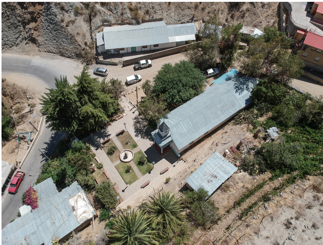
Fotografía aérea contexto Iglesia de Horcón, Comuna de Paihuano.

Contigua a la iglesia, en el sector trasero, y en el mismo predio, existe una construcción que correspondía a la casa parroquial, construida en la década de 1970. Actualmente es utilizada por el Comité de Agua Potable, organización que colabora con la iglesia, según información entregada por la comunidad.