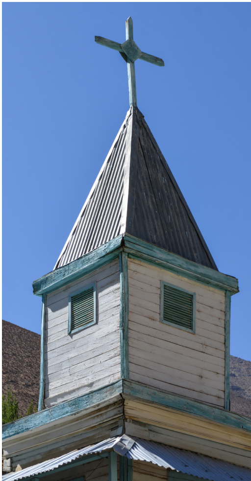
Fotografía exterior de la torre.

La data más reciente, y el evidente cuidado de la comunidad, denotan un buen estado de conservación en revestimientos y bienes muebles.