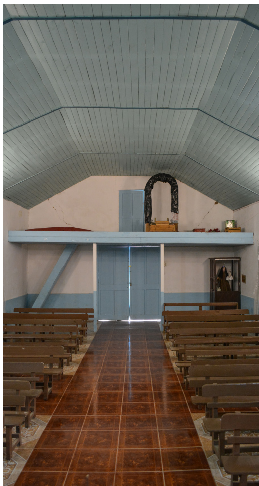
Vista hacia el acceso.

Interiormente, la nave central posee el mismo cielo que poseen la mayoría de las iglesias catastradas, compuesto en tres planos que se adhieren a la estructura de cubierta, revestido con entablado de madera. Mientras que el piso está revestido con cerámicos. Desde la nave se accede al presbiterio, y desde esta área a través de un amplio vano se accede a la sacristía, que se adosa al volumen principal.