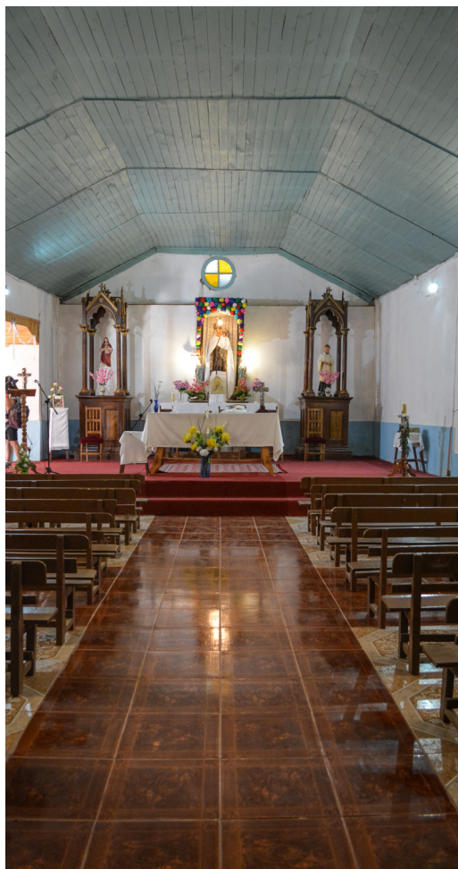
Vista hacia el altar.

Desde el lado derecho del acceso principal, se puede acceder por una pronunciada escalera al coro, un espacio sin balaustrada, desde el cual se accede a través de una puerta a la torre campanario y su balcón.