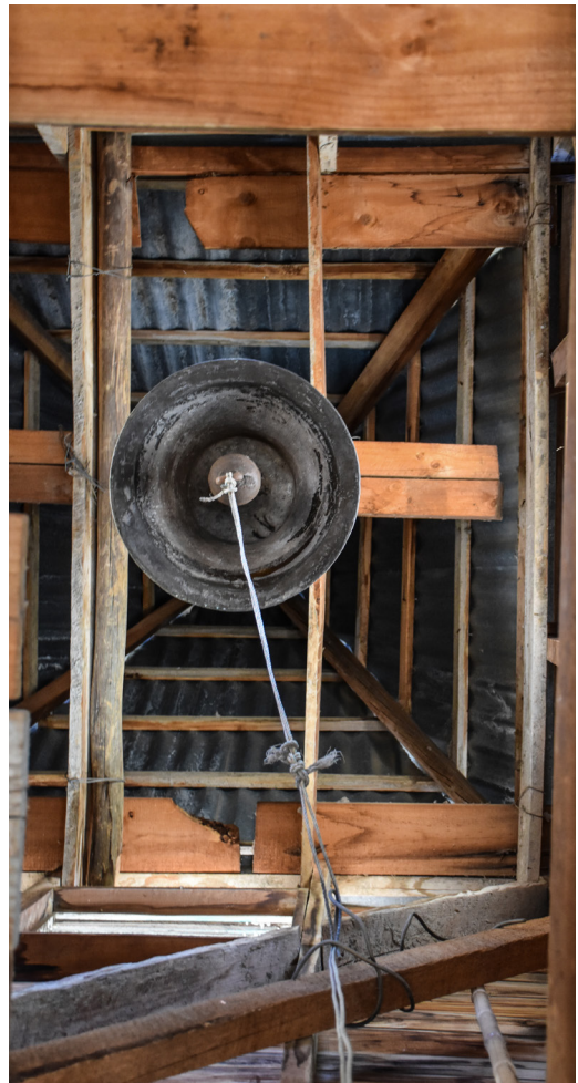
Fotografía estructura campanario.