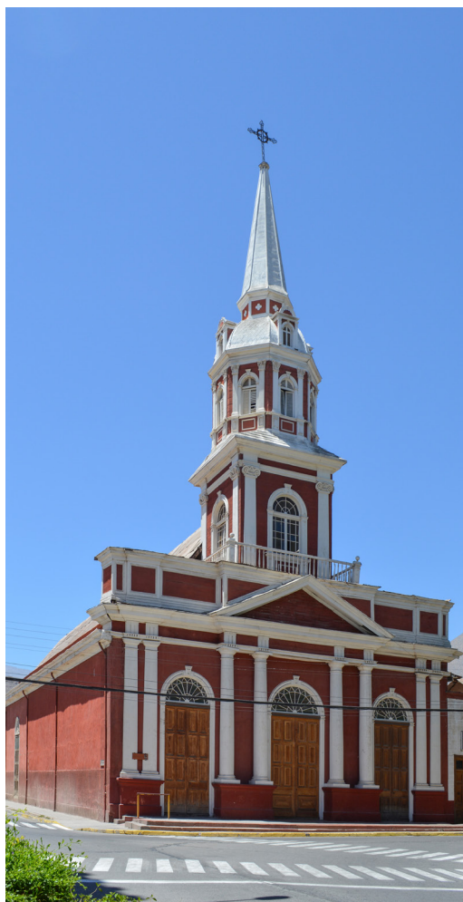
Fotografía fachada Iglesia de Vicuña.

Se estructura con muros tradicionales de adobe y sistema constructivo de madera. Los pilares de columnata se estructuran de