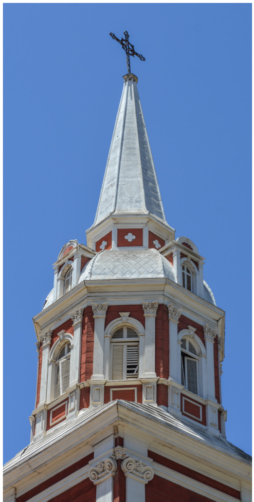
Detalle de la torre.