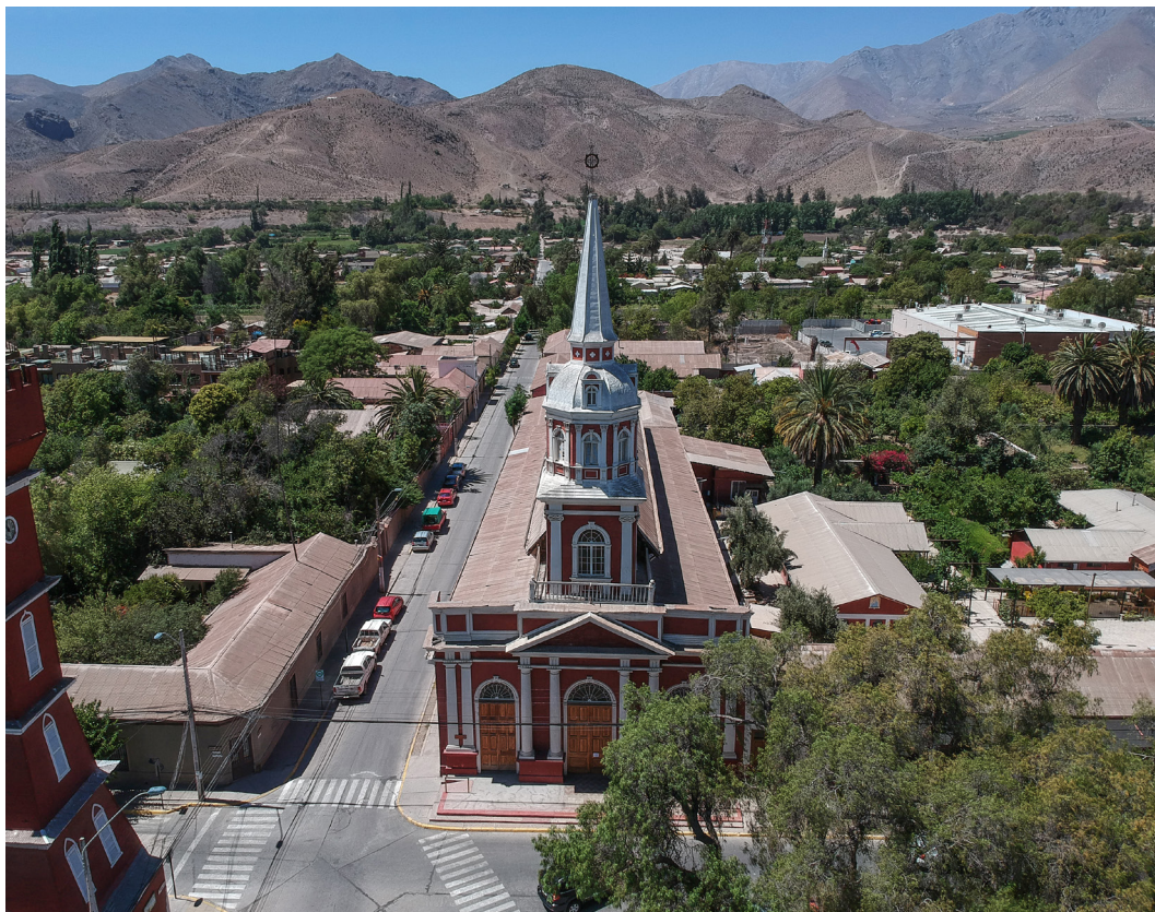
Fotografía aérea contexto Iglesia de Vicuña, Comuna de Vicuña.

iglesia. Por lo tanto, debiera entenderse este como un conjunto de interés patrimonial, que conforman parte importante de la identidad del pueblo de Vicuña.