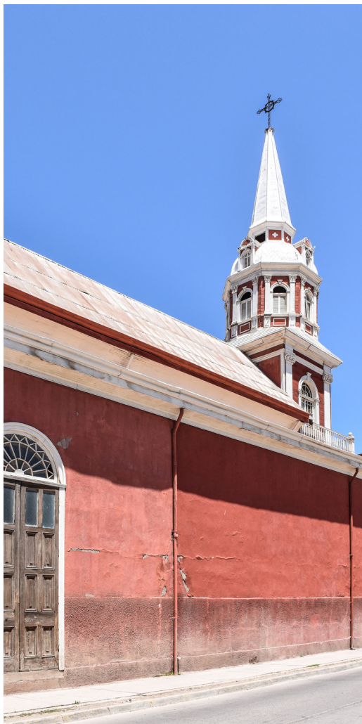
Fotografía lateral exterior Iglesia de Vicuña.