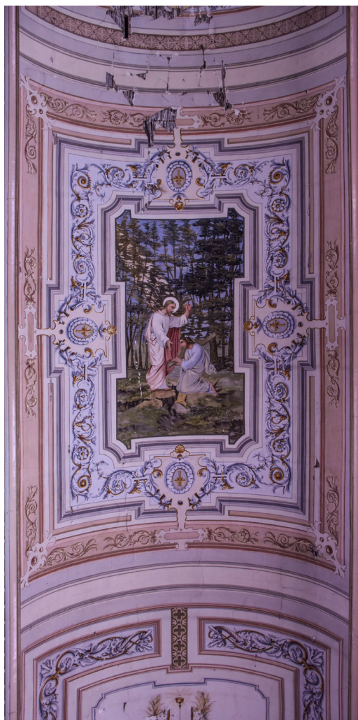
Detalle de mural, cielo nave central.