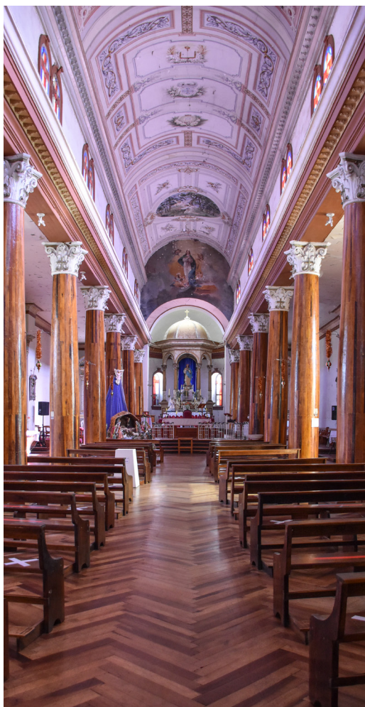
Vista hacia el altar.

igual forma que las tradicionales iglesias de Chiloé, con una estructura de pilar central cuadrado de madera, en este caso de pino oregón, con anillos de madera que le dan la terminación curva, a los cuales se clava el revestimiento de fustes de columnas, y posteriormente se adhieren elementos de terminación como basamentos y capiteles, estos últimos de estilo corintio.