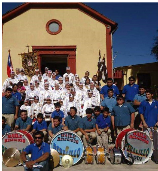
Fotografía baile religioso de Peralillo.