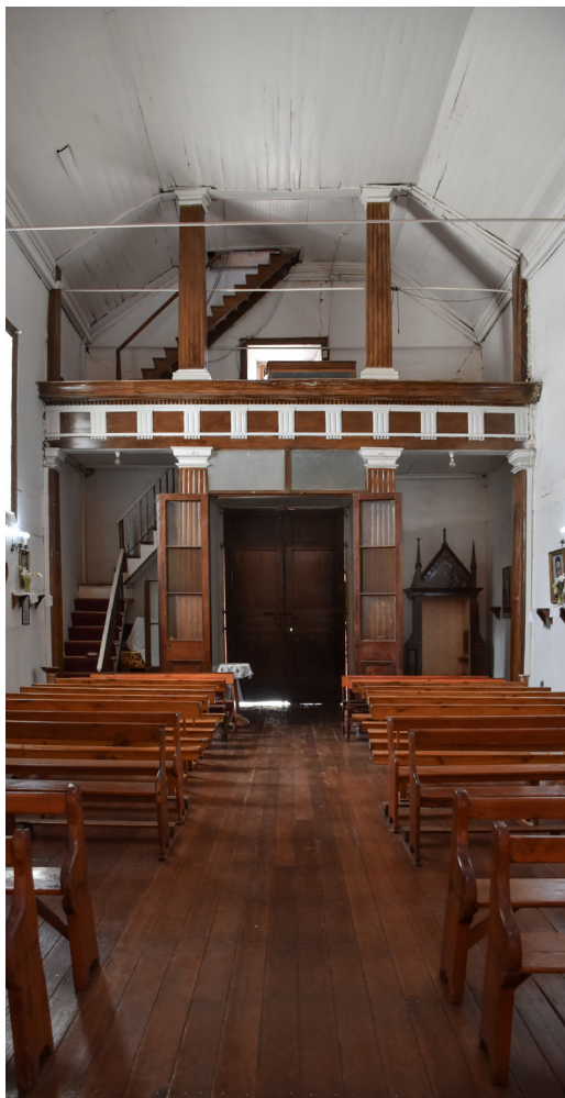
Vista hacia el acceso.

utilizan para llamar a todos los peralillanos a los oficios religiosos que se realizan en el templo”, relata Geisse.