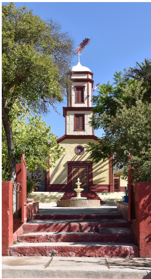
Fotografía exterior frontal, acceso Iglesia de Peralillo.