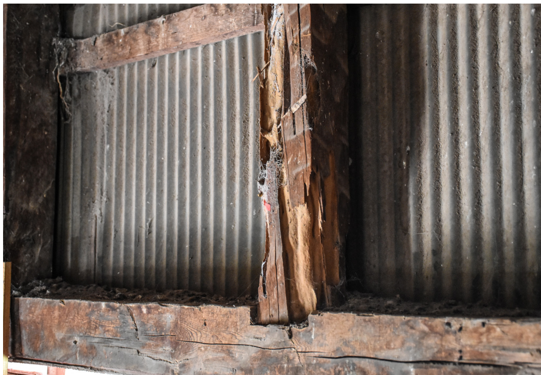
Detalle estructura de techumbre, piezas afectadas por acción xilófagos.

Sobre elementos de terminación como ornamentos del coro, pilastras de ventanas y altar mayor, existen gruesas capas de barniz y pinturas que denotan, por un lado, el esfuerzo de la comunidad en la mantención de su capilla, pero que impiden la correcta puesta en valor de estos elementos arquitectónicos. Sería recomendable realizar algunos decapados en los elementos para conocer cuál es su color original y eventualmente restaurarlos correctamente.