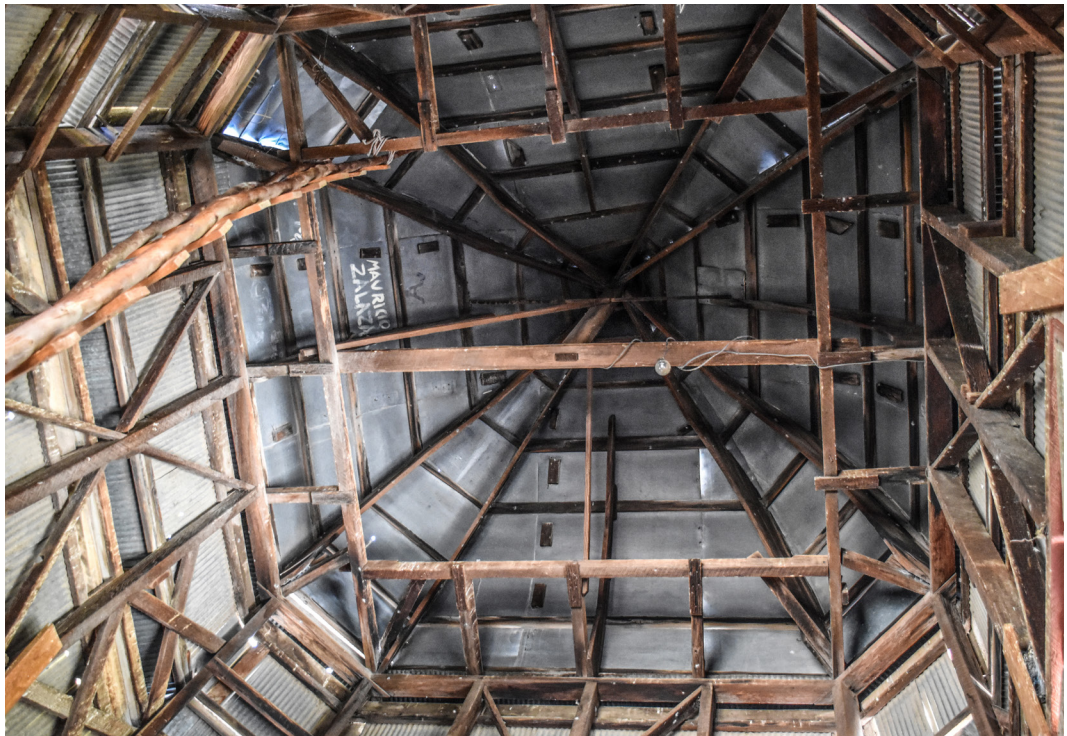
Fotografía estructura torre.