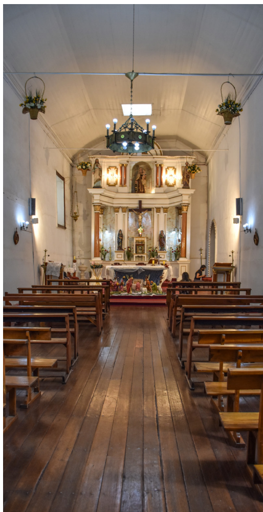
Vista hacia el altar.

“Al costado derecho de la única nave, en la entrada del templo, se encuentra la escalera que permite acceder al coro, donde se mantiene en perfecto estado el centenario armonio que acompaña las celebraciones litúrgicas. Desde el coro, se puede acceder a la única torre, con sus dos niveles, siendo coronada con la cruz (...). En el primer nivel de la torre, podemos encontrar dos centenarias campanas, cuya data de instalación se concreta en el año de 1890, y que aún se