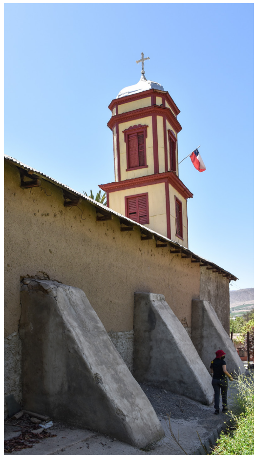
Fotografía exterior contrafuertes laterales.