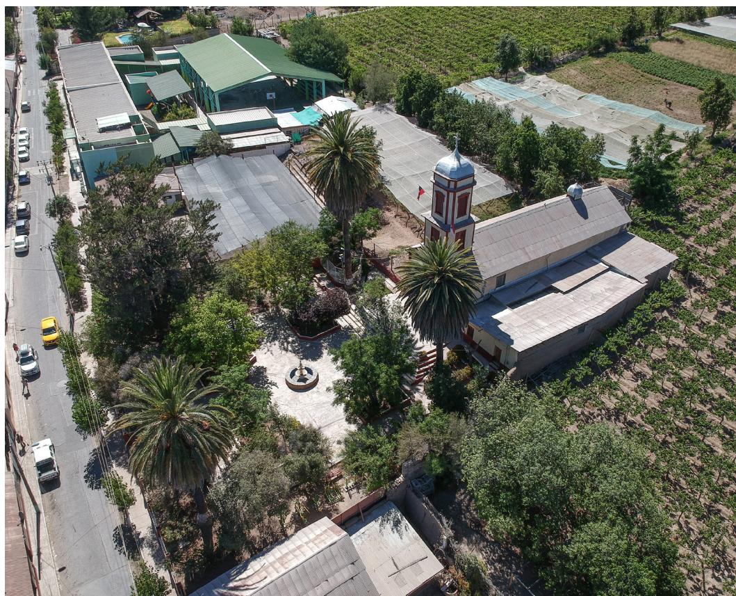
Fotografía aérea contexto Iglesia de Peralillo, La Serena.

La iglesia es parte de un conjunto urbano de interés patrimonial, pues el poblado conserva varios inmuebles tradicionales de líneas simples, y sistema constructivo vernáculo de adobe y madera. Este conjunto se estructura en un eje principal de fachadas continuas, el cual se interrumpe en el acceso a la capilla, por una plaza que en distintos niveles configura el atrio de la iglesia y espacio público protagónico de la localidad.